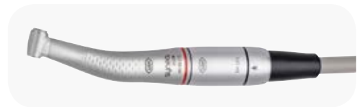
ISO Short WK-93 LTS + EM-12 L + VE-10