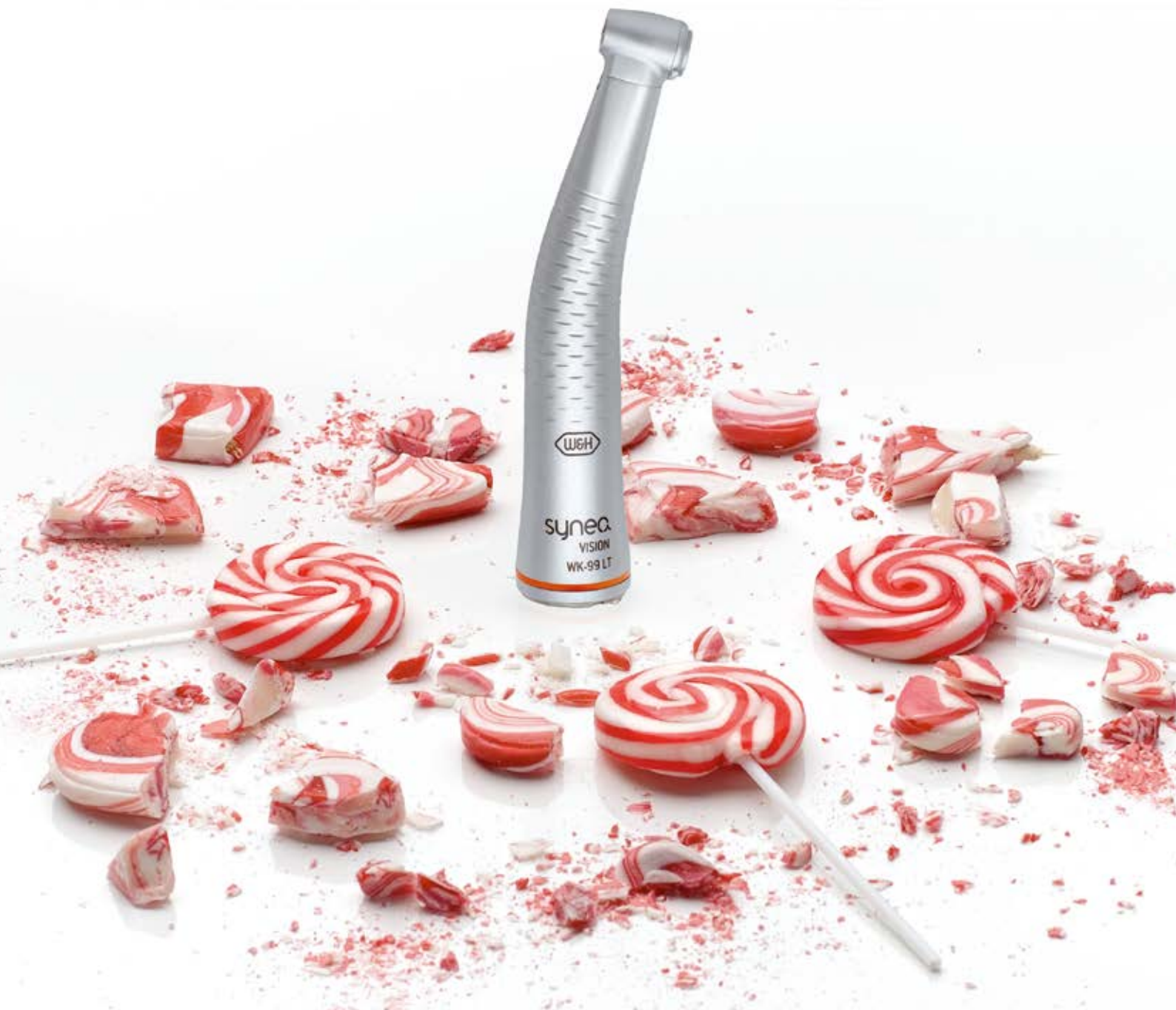
Abb. Symbolfotos. Zusatz-Ausstattung und Inhalt der gezeigten Zubehörteile sind nicht im Lieferumfang enthalten.

QR-Code mit dem Mobiltelefon scannen und mehr über Synea Winkelstücke erfahren