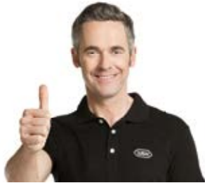
W&H Technischer Service

»Je besser die Pflege, desto länger die Freude.« Die regelmäßige Reinigung und Pflege Ihrer Instrumente schützt vor vorzeitigem Verschleiß und unnötigen Servicekosten.