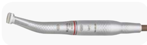
ISO Standard WK-93 LT + EM-E8 LED + VE-9